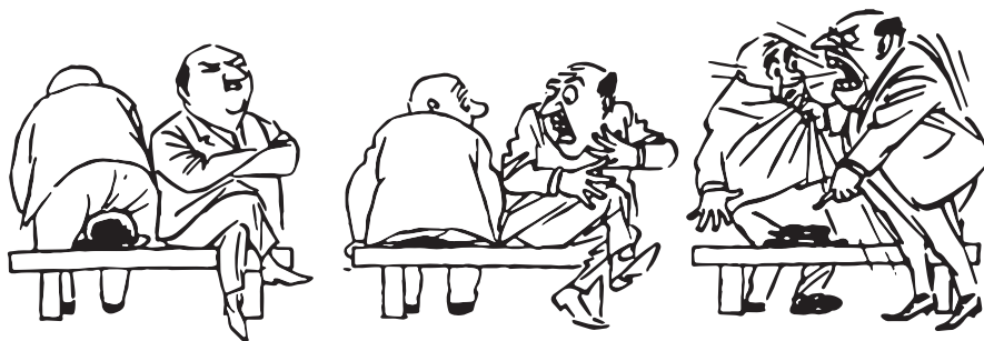
■ Холерический темперамент

и устойчивостью того воздействия, которое производит определённое впечатление на человека. Она связана с эмоциональной сферой и проявляется в силе, скорости и устойчивости эмоциональной реакции на воздействие. Сейчас уже доказано, что наиболее чувствительным типом является тип слабый (меланхолик).