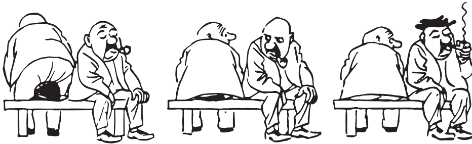
■ Флегматичный темперамент

Сангвиник способен быстро сосредоточиться, дисциплинирован, при желании может сдерживать проявления своих чувств и произвольные реакции. Ему присущи быстрые движения, гибкость ума, сообразительность, быстрый темп речи, быстрое включение в новую работу. Высокая пластичность проявляется в изменчивости чувств, настроений, интересов и стремлений. Сангвиник легко сходится с новыми людьми, быстро привыкает к новым требованиям и обстановке. У сангвиника чувства легко возникают, легко меняются.