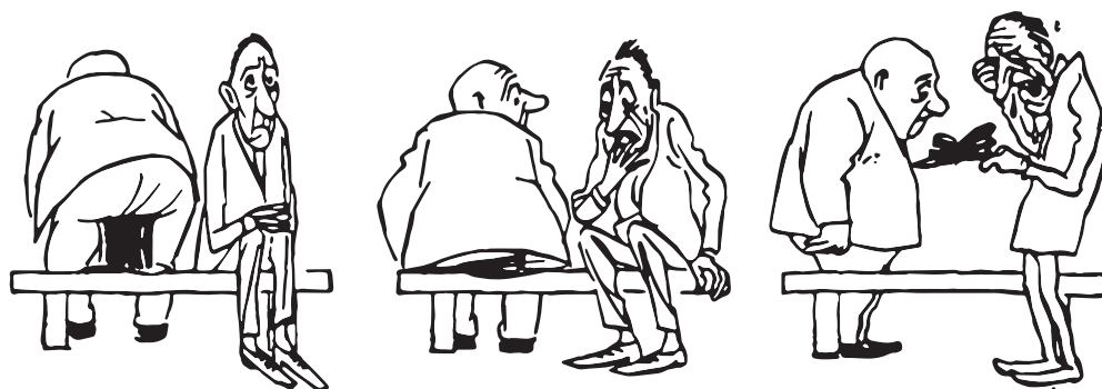
■ Меланхолический темперамент