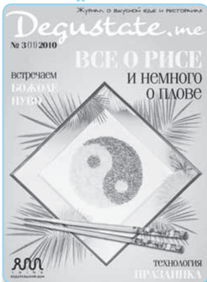
■ Обложка одного из езинов издательского дома «iZine»